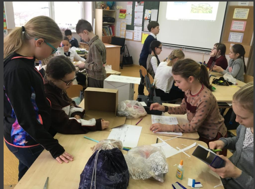
Komanda “Lietuvos laumės”