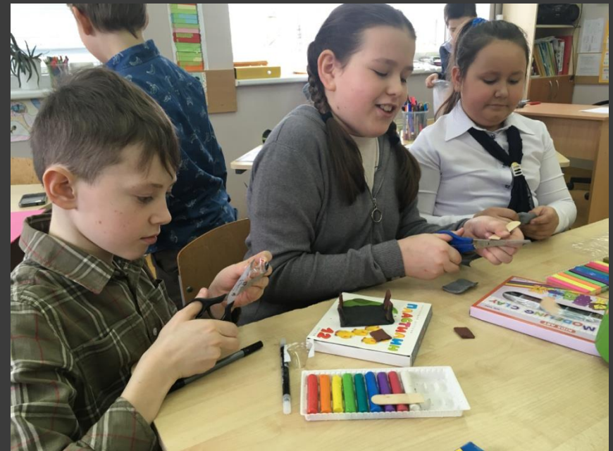
Komanda “Trys spalvos”