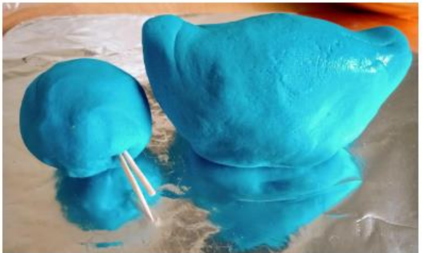
Galvos sujungimas su kūnu