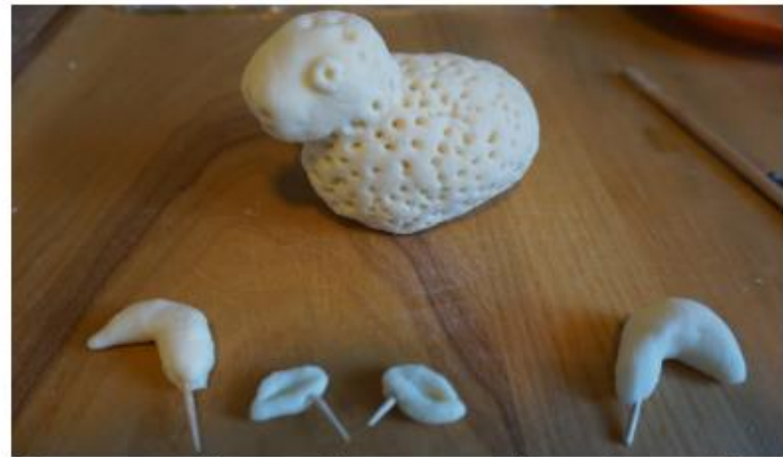
Papuoštas kūnas ir detalės