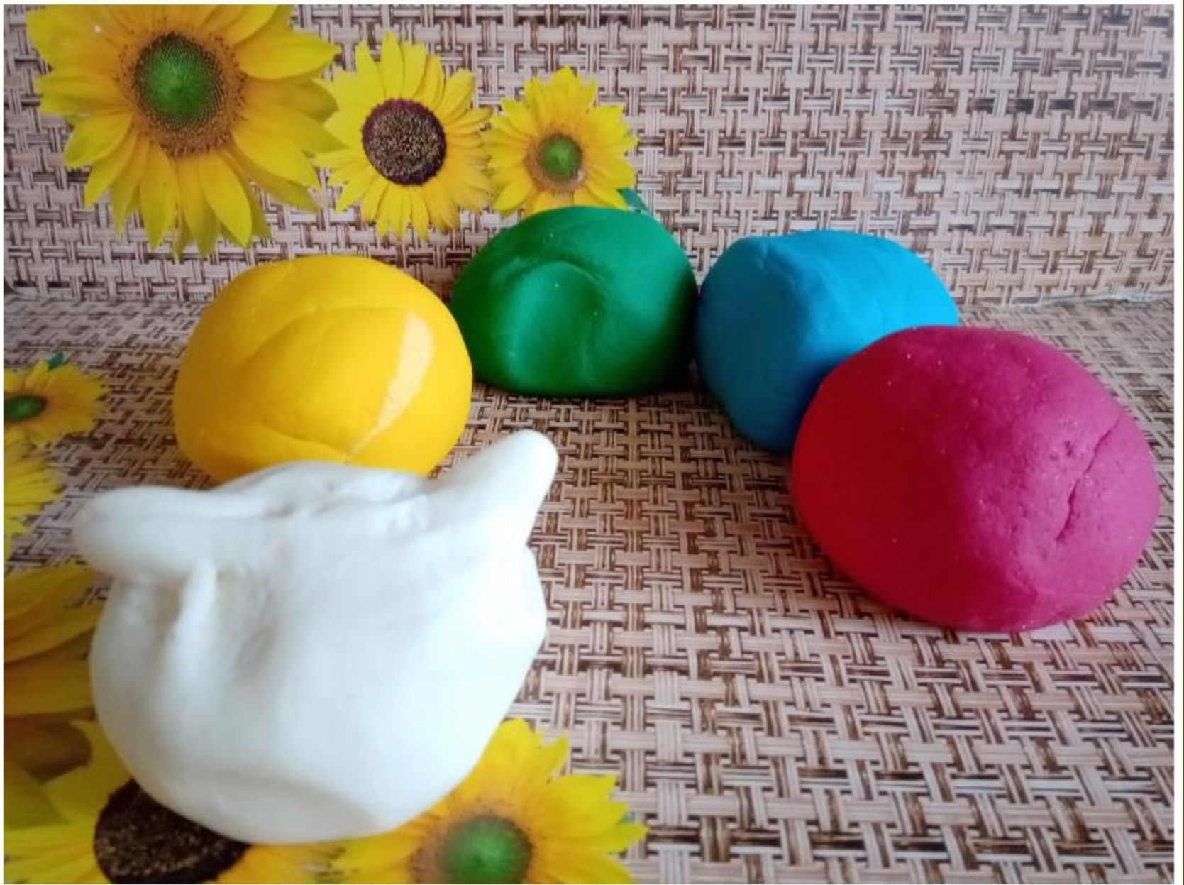
Pagaminta skirtingų spalvų tešla.